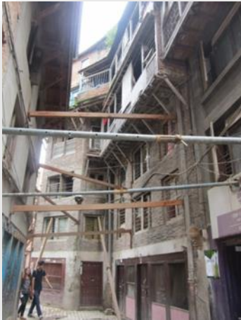
Provisorische Stützen bei alten Häusern

Am 25. April 2015 wurde Nepal von einem Erdbeben der Stärke 7,8 getroffen; welchem etwa zwei Wochen später ein weiteres Beben der Stärke 7,3 folgte; seitdem gab es mehr als 500 Nachbeben bis zu Stärke 5.5. Mehr als 9600 Menschen wurden getötet und Millionen sind betroffen.